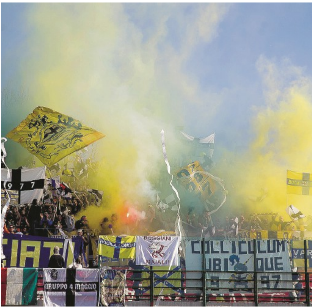
A Forlì La curva degli ultras del Parma durante il match di ieri: prima di un movimentato dopo partita.

Forse ha giocato il nervosismo per essere rimasti «appiedati» o forse il dietro-front di un grup-