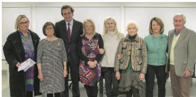
Magistrato e politico Stefano Dambruoso, terzo da sinistra, con i promotori dell'incontro.