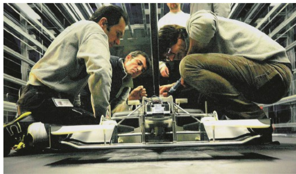
Rombi vincenti Ogni weekend 300 Dallara partecipano alle gare internazionali più importanti.

La Dallara rappresenta una realtà d'eccellenza del nostro territorio. Fondata nel 1972 da Gian Paolo Dallara, oggi è una delle più importanti aziende specializzate nella progettazione, produzione e sviluppo di vetture da competizione.