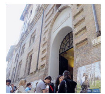
Borsa di studio Martedì la consegna all'Università (nella foto).

Per il 2013 la borsa di studio è stata destinata ad un neolaureato in Giurisprudenza, da non più di due anni, che avesse presentato un progetto di ricerca da svolgere in un centro di ricerca nazionale o internazionale e con